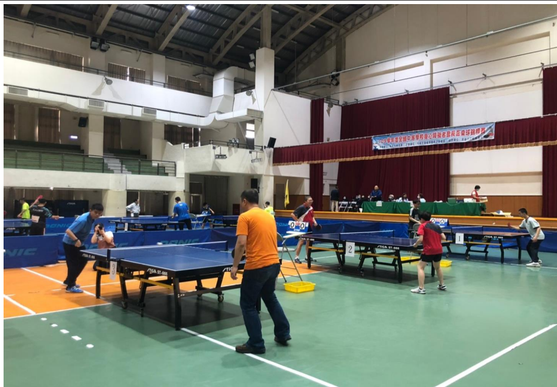
正式比賽場地-熱身狀況 110.3.27