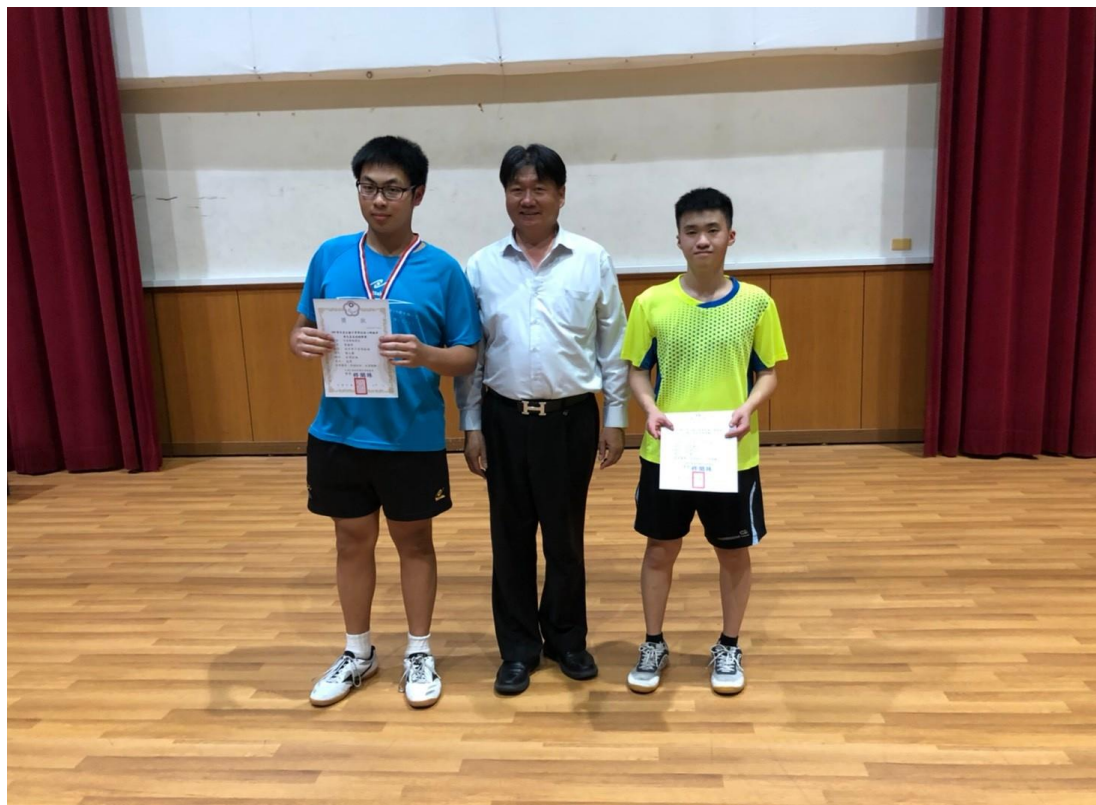
高中男子自閉組獲獎選手