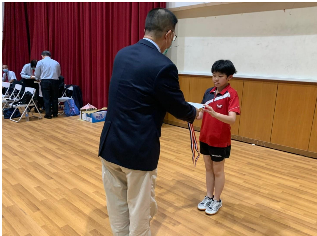
國中女子自閉症組獲獎選手