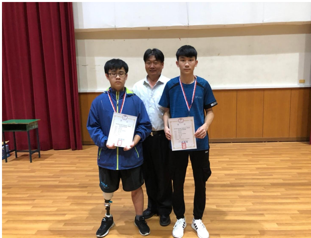
高中男子肢障組獲獎選手